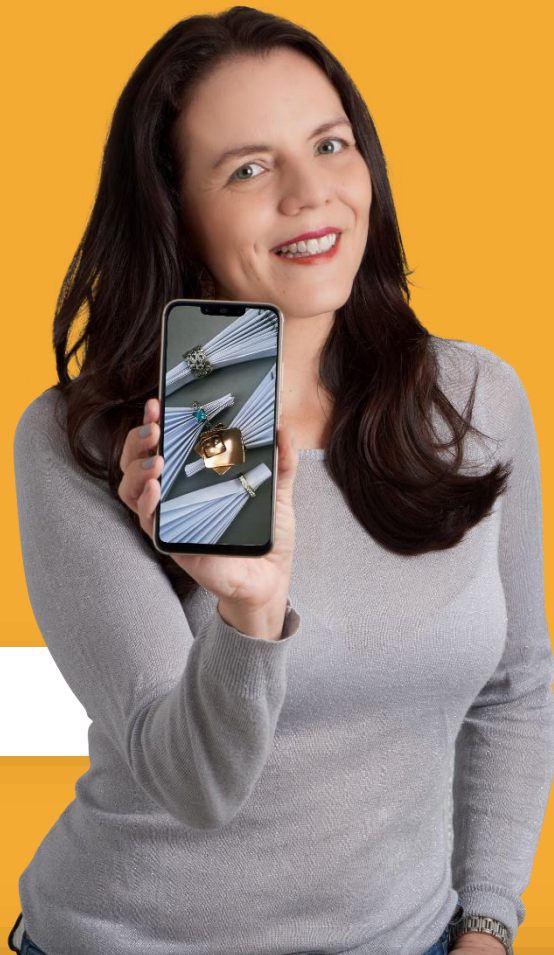
Pilar Linares Fotógrafa Profesional